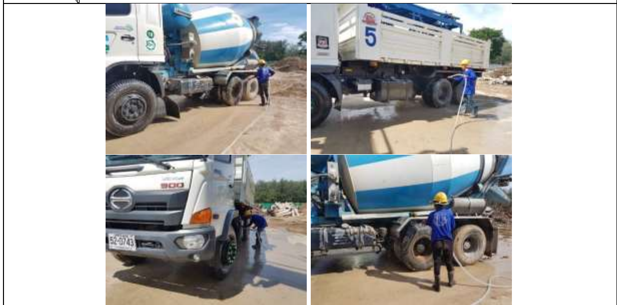
รูปที่ ๗7.7 คนงานล้างทำความสะอาดล้อรถบรรทุก