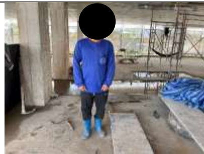
รูปที่ ผ7.22 หัวหน้าคนงาน