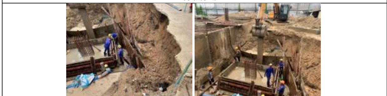
รูปที่ ผ7.5 แผ่นเหล็กค้ำยัน