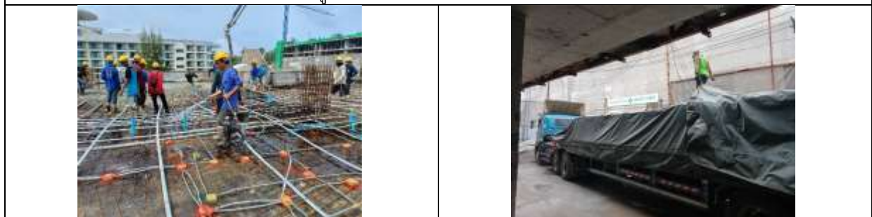
รูปที่ ผ7.2 คนงานฉีดพรมน้ำบริเวณพื้นที่ก่อสร้าง