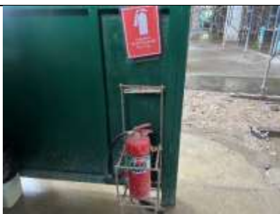
รูปที่ ผ7.25 ถังดับเพลิงเคมี

ภาพถ่ายผลการปฏิบัติตามมาตรการป้องกันและแก้ไขผลกระทบสิ่งแวดล้อม และติดตามตรวจสอบคุณภาพสิ่งแวดล้อม โครงการโรงแรมไอบิส สไตล์ ภูเก็ต บางเทา (IBIS STYLES PHUKET BANG TAO) ระยะก่อสร้างฐานราก และระยะก่อสร้างทั่วไป ประจำเดือนมกราคม-ธันวาคม 2567