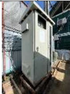
รูปที่ ผ7.23 แผงควบคุมวงจรไฟฟ้า