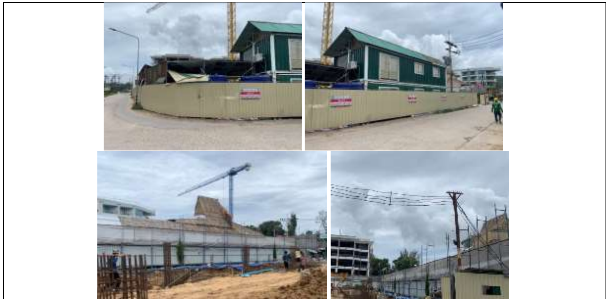
รูปที่ ผ7.1 รั้ว Aluminium Sheet

ภาพถ่ายผลการปฏิบัติตามมาตรการป้องกันและแก้ไขผลกระทบสิ่งแวดล้อม และติดตามตรวจสอบคุณภาพสิ่งแวดล้อม โครงการโรงแรมไอบิส สไตล์ ภูเก็ต บางเทา (IBIS STYLES PHUKET BANG TAO) ระยะก่อสร้างฐานราก และระยะก่อสร้างทั่วไป ประจำเดือนมกราคม-ธันวาคม 2567