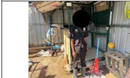
รูปที่ ผ7.21 เจ้าหน้าที่รักษาความปลอดภัย (รปภ.)