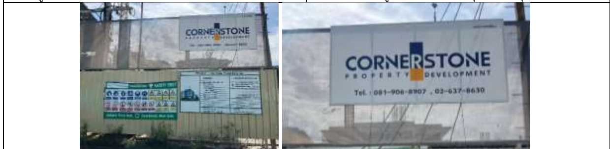
รูปที่ ผ7.4 ป้ายประชาสัมพันธ์รายละเอียดโครงการ พร้อมทั้งแสดงที่อยู่ หมายเลขโทรศัพท์เพื่อรับข้อร้องเรียนหรือข้อเสนอแนะ