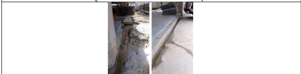
รูปที่ ๗7.8 ร่องระบายน้ำแบบชั่วคราวโดยรอบพื้นที่โครงการ