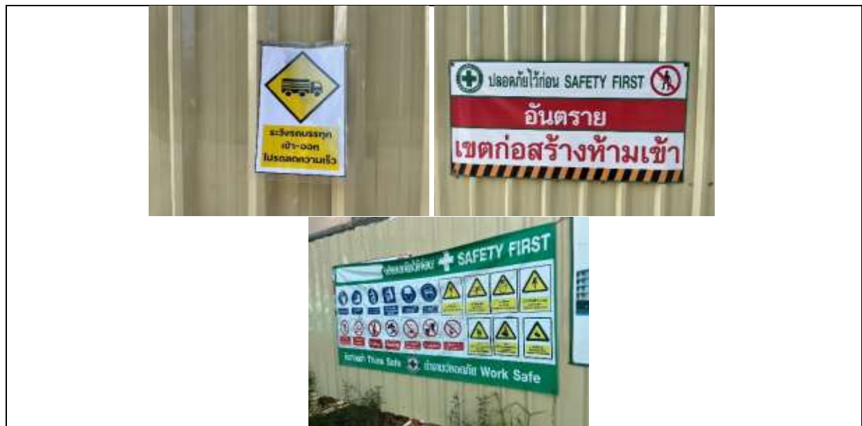
รูปที่ ผ7.20 ป้ายสัญญาณจราจร และป้ายเตือนต่าง ๆ เช่น ป้ายระวังรถบรรทุกเข้า-ออกโปรตรระวัง และป้ายแสดงเขตพื้นที่ก่อสร้างบริเวณทางเข้า-ออก พื้นที่โครงการ

ภาพถ่ายผลการปฏิบัติตามมาตรการป้องกันและแก้ไขผลกระทบสิ่งแวดล้อม และติดตามตรวจสอบคุณภาพสิ่งแวดล้อม โครงการโรงแรมไอบิส สไตล์ ภูเก็ต บางเทา (IBIS STYLES PHUKET BANG TAO) ระยะก่อสร้างฐานราก และระยะก่อสร้างทั่วไป ประจำเดือนมกราคม-ธันวาคม 2567