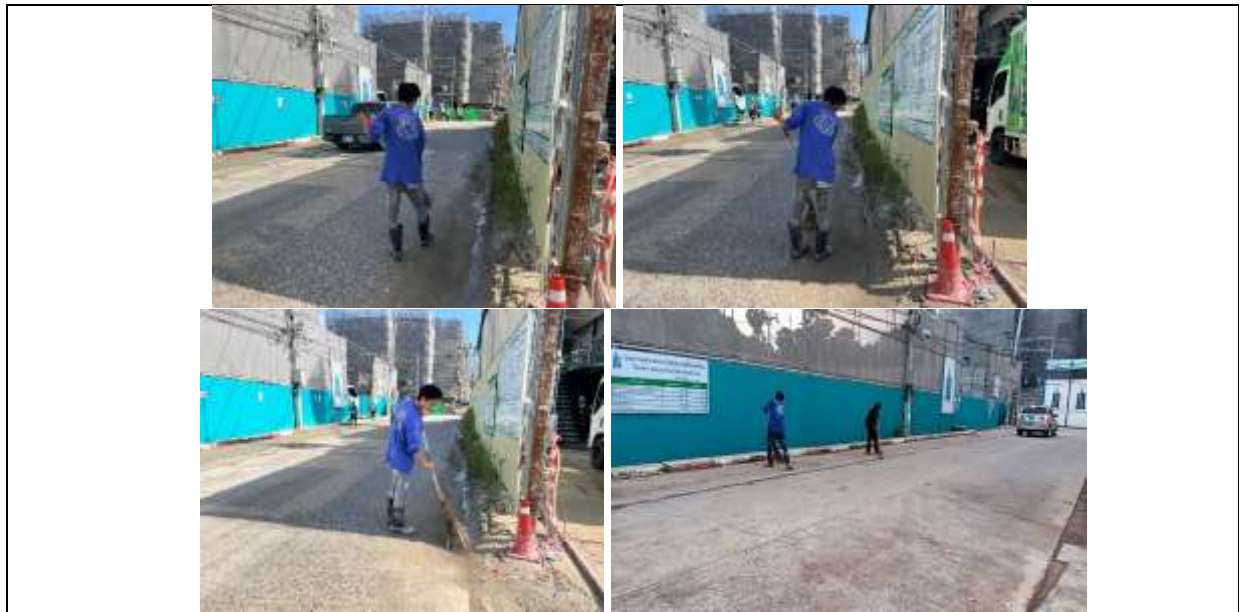
รูปที่ ๗7.6 คนงานเก็บกวาดเศษหิน ดิน ทราบบริเวณทางเข้า-ออกพื้นที่ก่อสร้างให้สะอาดเรียบร้อย

ภาพถ่ายผลการปฏิบัติตามมาตรการป้องกันและแก้ไขผลกระทบสิ่งแวดล้อม และติดตามตรวจสอบคุณภาพสิ่งแวดล้อม โครงการโรงแรมไอบิส สไตล์ ภูเก็ต บางเทา (IBIS STYLES PHUKET BANG TAO) ระยะก่อสร้างฐานราก และระยะก่อสร้างทั่วไป ประจำเดือนมกราคม-ธันวาคม 2567