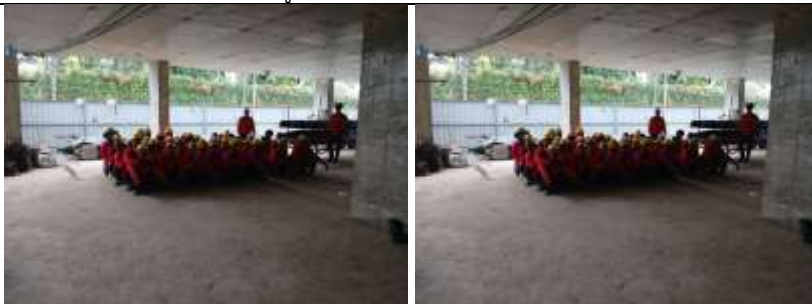
รูปที่ ผ7.26 Morning Talk