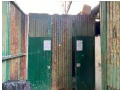
รูปที่ ผ7.24 ห้องส้วมสำหรับคนงาน